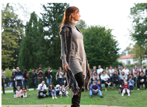
Défilé de mode