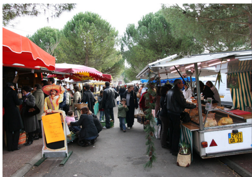
Marché campagnard